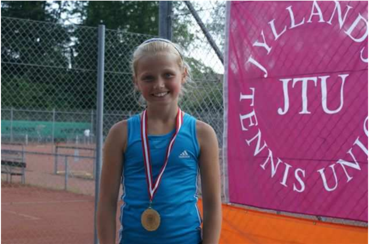
En glad u12 pige med guld om halsen efter en hård og velspillet kamp