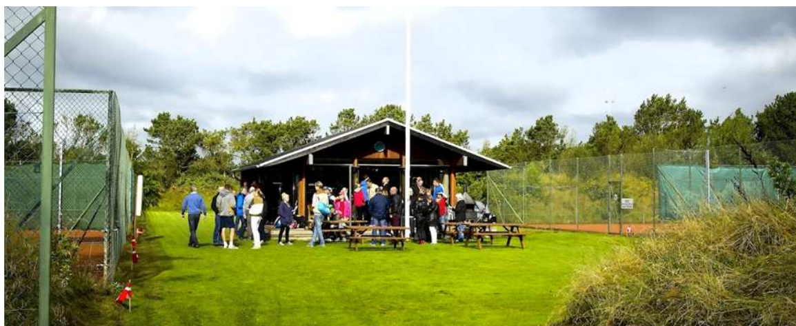
Viborg Lawn Tennis Forening – foto fra det hyggelige klubhus

I JTU synes vi, at der er for få ungdomsspillere i alle aldre, der deltager i turneringer. Det er vores plan, at sætte kræfter ind på, at vi bliver mange flere fremover. Vi vil gøre en indsats for at få mange børn interesseret i "tennis U10". Det vil naturligvis kræve en indsats fra både JTU og de jyske klubber.