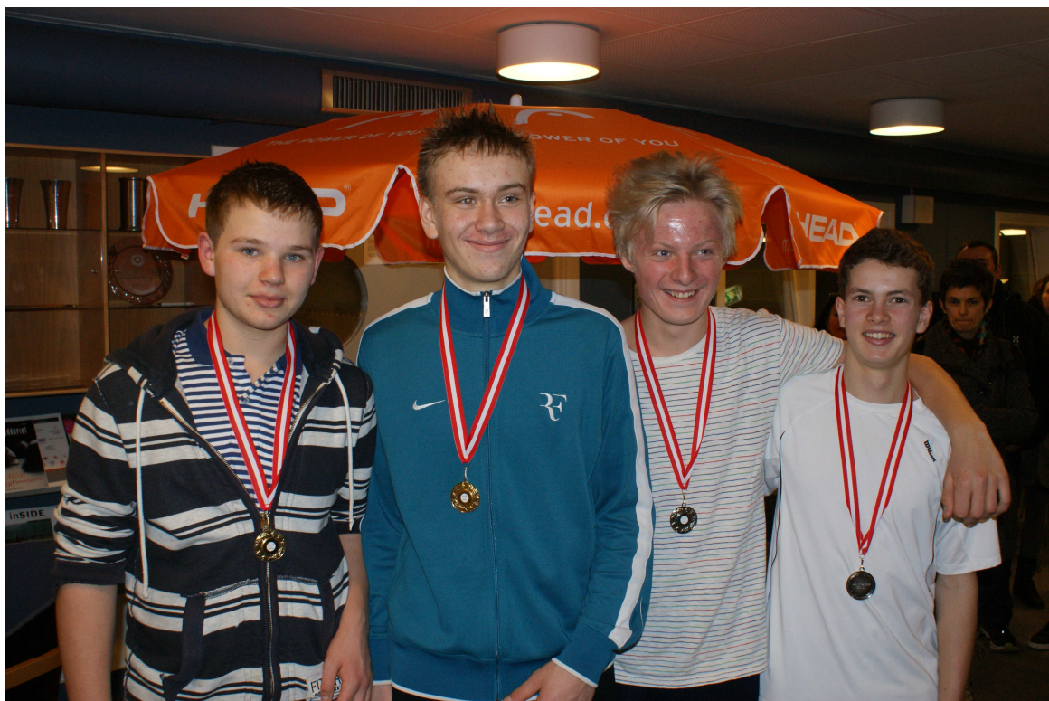
Glade vindere i Kolding