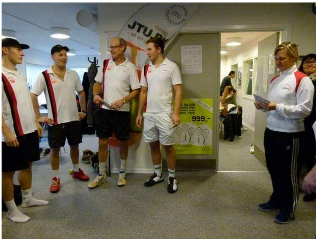
4 spillere fra Aarhus 1900 tog turen til Kolding Ketcher Center for at afgøre herredoublefinalen

Du kan se resultaterne fra finalestævnet vedlagt som bilag